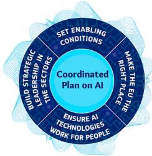
Imagem 4: Representação gráfica da "Revisão de 2021 do Plano Coordenado para a Inteligência Artificial" – retirado em agosto de 2023 9

Neste sentido o plano inclui quatro grandes conjuntos de objetivos políticos (Imagem 4): criar condições propícias ao desenvolvimento e à adoção da inteligência artificial na EU; fazer da EU um local onde a excelência impera desde o laboratório até ao mercado; assegurar que a inteligência artificial está ao serviço das pessoas e é uma força positiva para a sociedade e; reforçar a liderança estratégica em setores de impacto elevado. Para cada um deles estão definidas várias perspetivas com propostas e recomendações concretas de ações futuras.