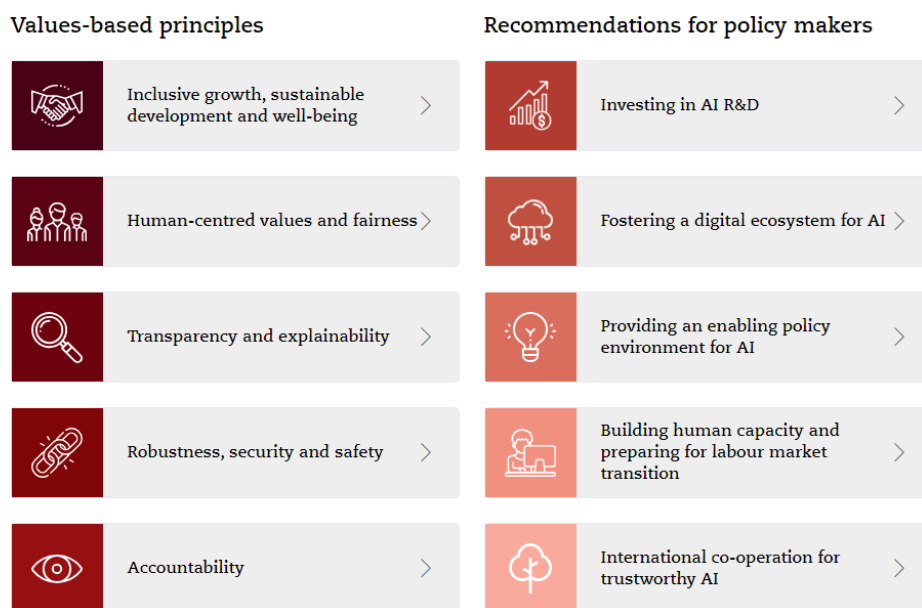
Imagem 2: Representação gráfica da “Recommendation of the Council on Artificial Intelligence” – retirado em agosto de 2023 b

Um bom exemplo é a “Recommendation of the Council on Artificial Intelligence” (OCDE, 2019) adotada pela Organização para a Cooperação e Desenvolvimento Económico (OCDE) em maio de 2019, que estabelece padrões para a inteligência artificial que se pretende que sejam suficientemente práticos e flexíveis para resistirem ao teste do tempo, mesmo numa área de rápida evolução, e complementam outros padrões da OCDE em áreas como a privacidade, a gestão de riscos de segurança digital e a conduta responsável de negócio. No texto são identificados 5 princípios baseados em valores e cinco recomendações (Imagem 2) para legisladores relativas a políticas nacionais e cooperação internacional para uma inteligência artificial de confiança (Berryhill et al., 2019).