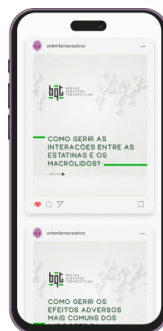
BREVES QUESTÕES TERAPÊUTICAS