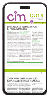
BOLETIM DO CIM